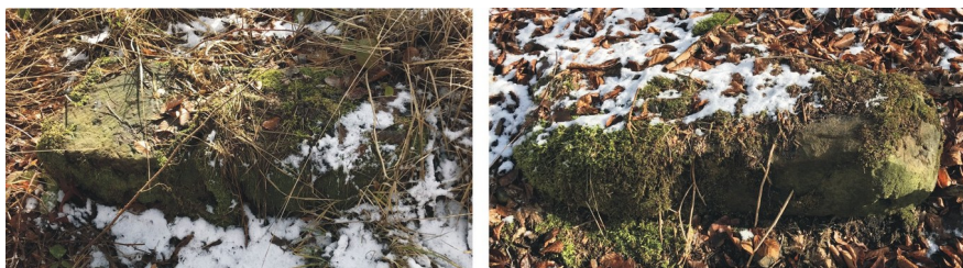
Ilustracja 2: Znalezione kamienie graniczne z 1733 roku: po lewej kamień północny, po prawej kamień południowy. Fotografia: Marian Gabrowski, luty 2020 roku.

W czasie naszej wędrówki odnaleźliśmy dwa cysterskie kamienie graniczne. Oba były dość trudne do zauważenia: wywrócone, porośnięte mchem i częściowo przykryte ściółką leśną. Ponieważ są to dwa bardzo podobne znaleziska, różniące się jedynie lokalizacją, dlatego też opiszę je łącznie, rozróżniał je będę jedynie za pomocą odmiennych określeń: kamień północny i kamień południowy.