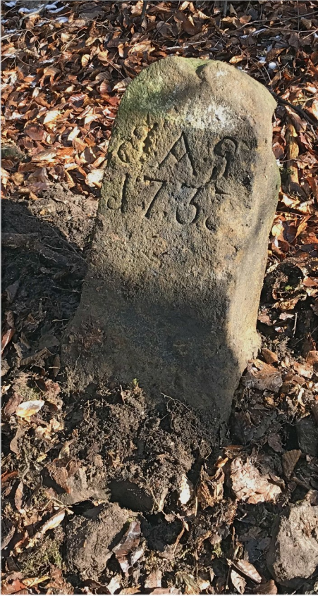
Ilustracja 5: Po jego odnalezieniu kamień północny został przez nas ustawiony w pozycji niemalże pionowej. Fotografia: Marian Gabrowski, luty 2020 roku.

Współrzędne opisywanych tu znaków granicznych to odpowiednio dla kamienia północnego: N 50°46'42", E 16°04'28", dla południowego: N 50°46'40", E 16°04'30".