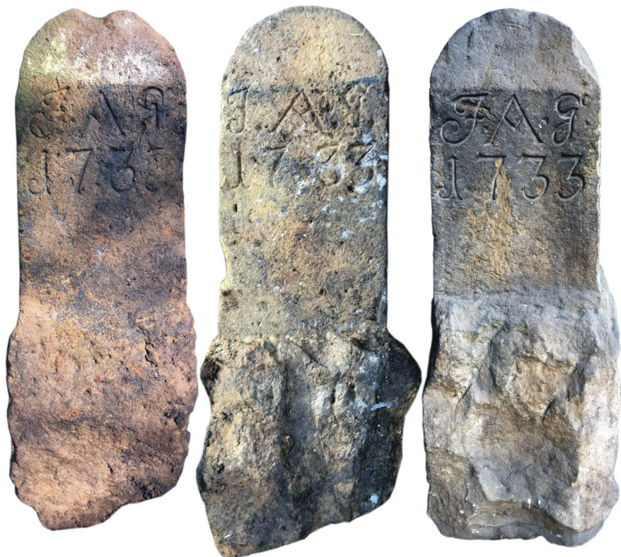
Ilustracja 4: Porównanie wyglądu „czadrowskich” kamieni granicznych. Po lewej kamień północny, po środku kamień południowy; fotografie: Marian Gabrowski, luty 2020 roku. Po prawej kamień z kamiennogórskiej ulicy Karola Miarki; fotografia: Marian Gabrowski, wrzesień 2019 roku.

Widoczne jest podobieństwo opisywanych tu kamieni do znaku granicznego eksponowanego od wielu lat przy kamiennogórskiej ul. Karola Miarki; tamten granicznik ma rzekomo pochodzić z Czadrowa, co przy tak dużym podobieństwie (patrz ilustracja 4) wydaje się być informacją prawdziwą. Również jego wymiary są zbliżone: szerokość 28 cm, grubość: 19 cm, wysokość części obrobionej: 45 cm; wysokość całkowita: 92 cm.