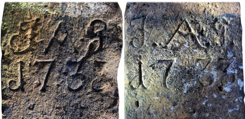
Ilustracja 3: Inskrypcje „I.A.G. 1733” na kamieniu północnym (po lewej) i południowym (po prawej). Fotografia: Marian Gabrowski, luty 2020 roku.

W czasie naszej wędrówki odnaleźliśmy dwa cysterskie kamienie graniczne. Oba były dość trudne do zauważenia: wywrócone, porośnięte mchem i częściowo przykryte ściółką leśną. Ponieważ są to dwa bardzo podobne znaleziska, różniące się jedynie lokalizacją, dlatego też opiszę je łącznie, rozróżniał je będę jedynie za pomocą odmiennych określeń: kamień północny i kamień południowy.